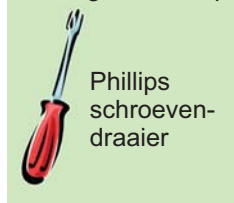
Phillips schroeven- draaier